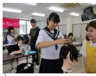
秋田ヘアビューティカレッジ