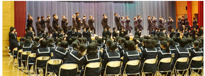
1年生によるダンス「USA」

3月6日(水)の午後、第1アリーナで送る会を開いてもらいました。全校生徒会、2年学年生徒会、1年学年生徒会が中心となって、下級生全員が3年生を送ってくれました。3年生に感謝の心を届けるため、一生懸命心をこめて準備してくれたことがよく分かる、素晴らしい会でした。