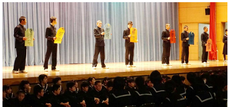
2年生からお守りのプレゼント