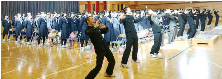
お礼に3年生最後のエール