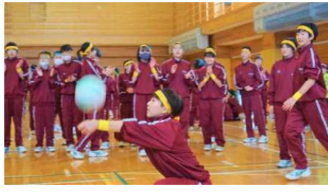
応援を背に、完璧なレシーブ！