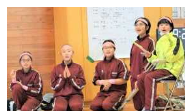
ファインプレーにびっくり