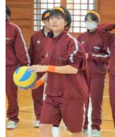
どこへ投げようか