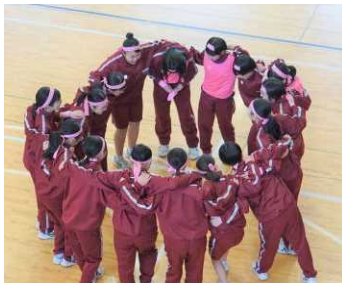
各組、気合いの入った円陣でした