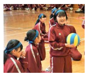
楽しい1日となりました