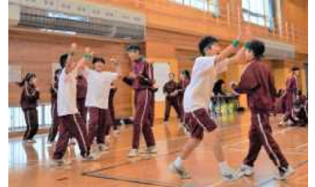
僅差での勝利にガッツポーズ！