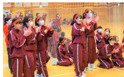
男子の勝利に大喜び！