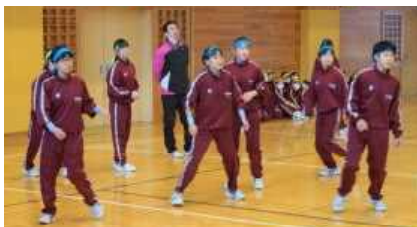
緊張感漂うドッチボールの内野