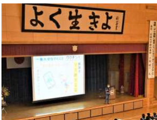
ようこそ大曲中へ