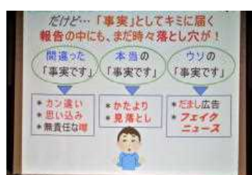
情報リテラシーがよくわかりました