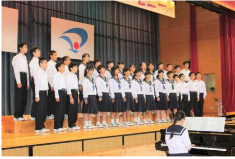
106 「HE IWAの鐘」