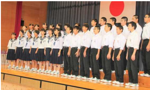
104 「HE IWAの鐘」