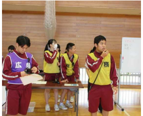
3年生→訓練7：避難所開設