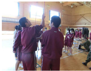
訓練9：災害緊急処置