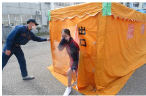
1年生→訓練2：煙道体験

訓練1として、地震発生時のシェイクアウト訓練の後全校で第1アリーナへ避難しました。その後学年に分かれ、全部で10の訓練を行いました。3年間で様々な訓練を経験できることが大曲中学校の防災訓練の特長です。中学生として自分はこの場で何ができるのか。考え、判断し、行動することが求められる防災訓練。この体験を、災害時のみならず、日々の生活にも生かしてほしいと思います。大仙市からいただいた「アルファ米」を今日持ち帰ります。どんな体験をしたか、お家でもぜひ話題にしてみてください。