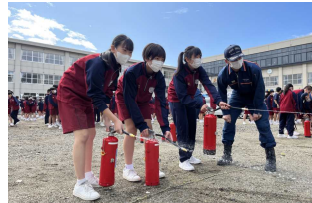
訓練4：初期消火訓練