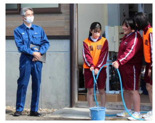
訓練10：飲用・生活用水確保