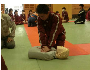
3年生→訓練8：救急救命処置