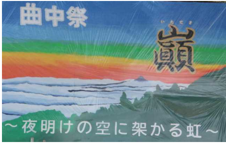
美術部有志が作成した大看板