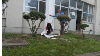
訓練3：高所救助訓練見学