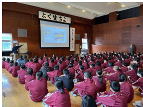
2年生→訓練5：防災講話