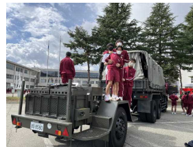
1・2年生 自衛隊車両見学