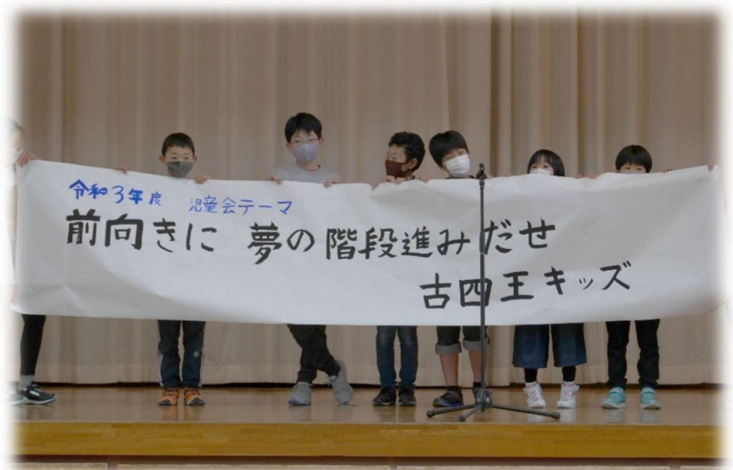
児童会テーマが発表されました。