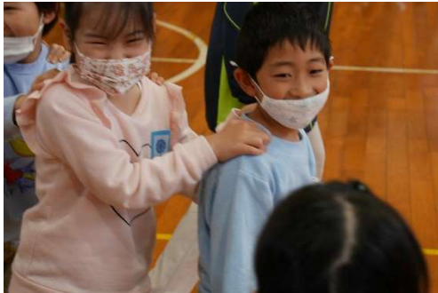
ステキな笑顔です！