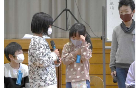
緊張しながらも、質問にしっかり答えていました。