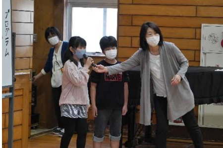
4年生の委員会デビュー

運営委員会主催の、1年生を迎える会が行われました。 インタビュー形式で、自分の名前、好きな動物、出身保育園を全校の前で紹介。 その後、クイズやじゃんけん列車などをして交流を深めました。