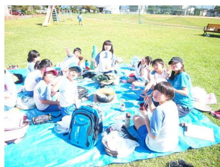
【なべっこ 一つの鍋をみんなで囲んで】

□ 修了式では、「教室（学校）は、まちがうところだ」の気持ちで今年1年を過ごすことができたのか、子どもたちと確認しました。そして、「新しい学年でも5つの気『元気 やる気 勇気 本気 根気』を益々強くして瞳を輝かせてください。」と話しました。また、4月から「新しい学年でがんばるための心構え」についても話しました。これまで使ってきた学習用具等の「物の準備」と、何を頑張っていくのかの「心の準備」が必要であることを伝えました。是非、ご家庭でも話題にして、令和6年度の準備をしていただきたいと思ひます。