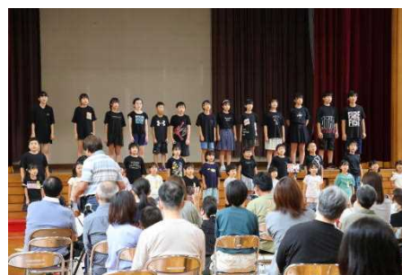
【学習発表会 全校で歌声を響かせて】