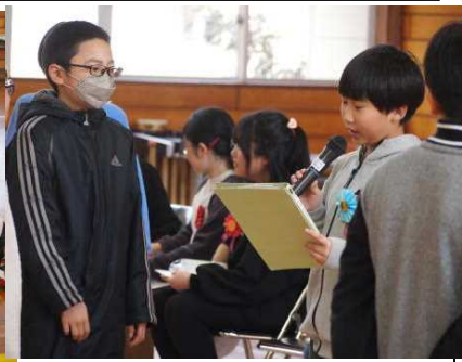
【委員長のバトンを渡す】