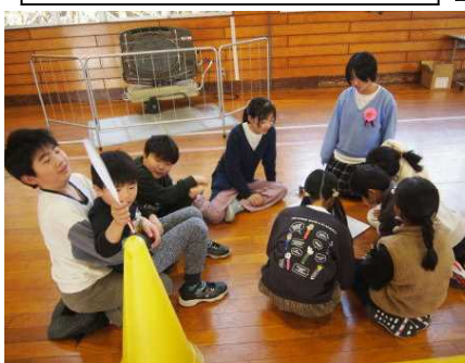
【全校からの寄せ書きプレゼント】

縦割りグループでじゃんけん列車を行いました。いつもは後方の6年生ですが、今日は先頭です。