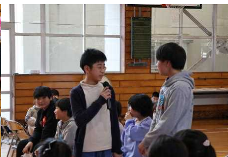
【思い出スクリーン】

下級生にエスコートされて6年生が入場しました。一人一人のポーズに笑顔になりました。