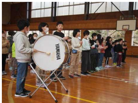
【みらい学年へエール】

6年生からお礼のダンスと合奏がありました。その前には6年生が作成した動画が流れました。その内容はブログで紹介しています。