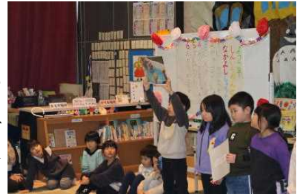
【1・2年生主催の仲よし集会】

2月13日(火)には、新入生保護者会を行いました。今年も昨年のように、4月に入学する子どもたちも一緒に来校し、1・2・5年生のお兄さんお姉さんたちと交流する時間を設けることができました。前半は1・2年生が「ようこそ しんいちねんせい なかよししゅうかい」と題して、新入生が喜んでくれる内容を考えて仲よし集会を行ってくれました。5年生はグループに分かれて、おすすめの本の読み聞かせをしてくれました。