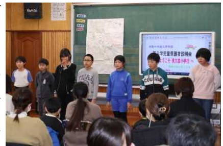
【新登校班長が元気に自己紹介】

説明会の最初には、新しい登校班の班長さんが新入生保護者の皆さんの前で、自己紹介をしました。はきはきと自己紹介する姿に、新しい学年に向かって4・5年生が張り切っていることが伝わってきました。