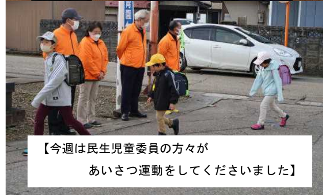
【今週は民生児童委員の方々 あいさつ運動をしてくださいました】