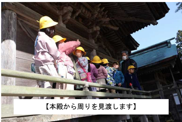
【本殿から周りを見渡します】

18日は3年生がイーストモールに行って、社会科の勉強をしてきました。お店の工夫と買い物をする人の工夫を学び、最後は自分で買い物をするという一番の勉強をしてきました。