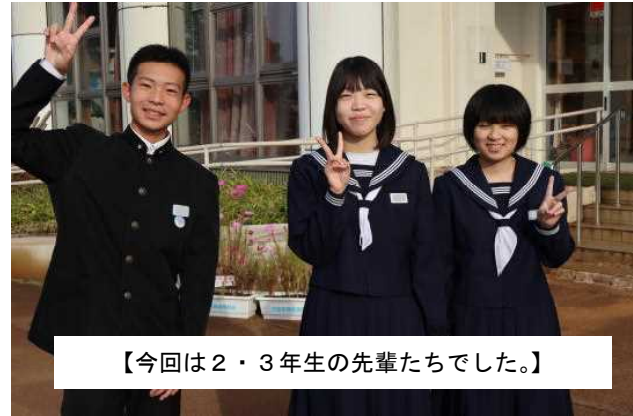
【今回は2・3年生の先輩たちでした。】

今週は、学校入り口の看板前で民生児童委員の方々が月曜日からあいさつ運動を行ってくださいました。毎月ではありませんが、年に数回この活動をしてくださっています。子どもたちの安全を見守りながら朝早く立ってくださいている方々に、元気なあいさつでお礼の気持ちを表しましょう。保護者の皆様からもお声掛けいただけたなら幸いです。