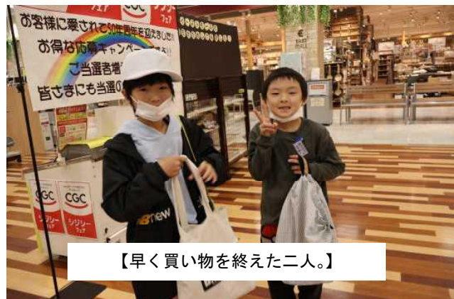
【早く買い物を終えた二人。】