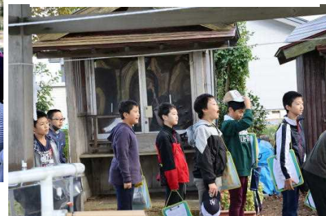
【帰る前にみんなで神社に一礼】