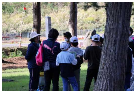
【みんなでワイワイ話しながら】