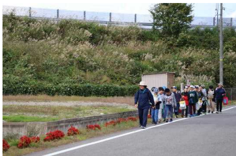
【フラワーロードの花も元気に】