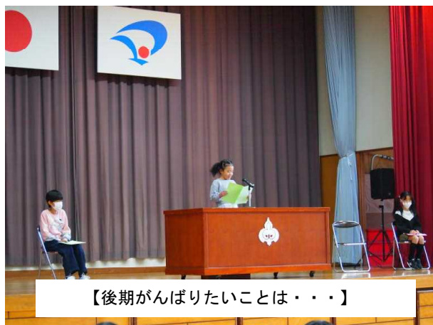
【後期がんばりたいことは・・・】

昨日から後期が始まりました。後期は、月が進む毎に新しい学年が見えてくる時期です。今は遠くにある新しい学年。しかし、今隣にいる一つ上のお兄さん・お姉さんたちの様子をよく見ていないと、自分がその立場になったときに困ることになります。そのことが意識できるように声を掛けながら、後期を過ごしていくことになります。毎日の生活の中で「できた!」「わかった!」を日々一つ一つ積み重ねながら、3月の姿を見据えつつ進んでいきたいと思えます。始業式で、後期のめあてが決まっているか手を挙げてもらったところ、まだ決まっていない人がほとんどでした。発表してくれた3人の発表内容を参考にしながら、後期のめあてを決めて実践して行ってほしいものです。式の中では、めあてを達成するために努力することが大切である旨の話をしました。自分の思うような結果に繋がらなくとも、その過程に注目して子どもたちに声を掛けていただけたなら幸いです。保護者の皆様には前期同様、様々な面でのご支援ご協力をお願いいたします。