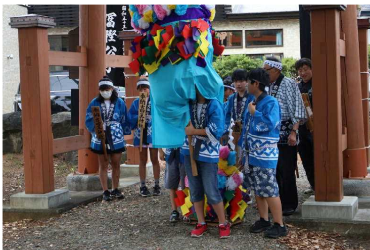
6年有志が梵天奉納

そのお菓子を、今日、子どもたちが持ち帰りました。下に「栄養成分表示」も付けましたので、食物アレルギーをご確認の上、お召し上がりください。