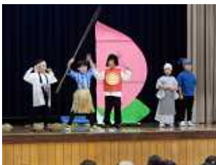
1年 劇 「～愛のジャンプ劇場～ 三太郎物語」