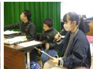
裏方でがんばる子どもたち