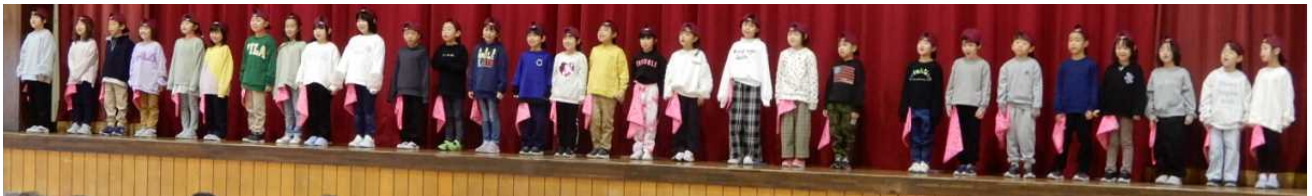
1年生によるはじめのあいさつ

今回の発表会について、改善点等のご意見がございましたら、いつでも学校までお寄せいただきたいと思います。当日は様々な点でのご協力、本当にありがとうございました。