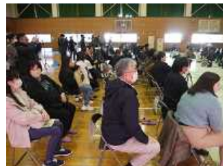
会場の客席の様子