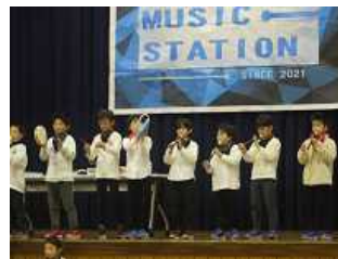
3年 バラエティー 「つばさミュージックステーション」