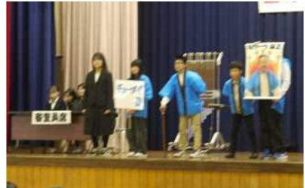
6年生によるおわりのあいさつ