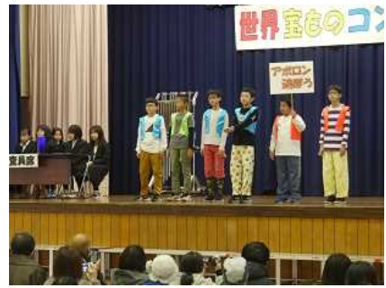
2年 バラエティー NHN「なんでも花館ニュース」 ～きりり学年の1日を伝えます～