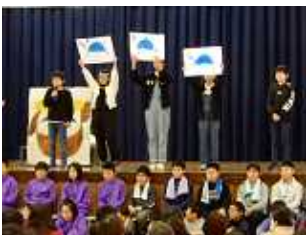
5年 劇 「保呂羽山でみつけた大切なもの」