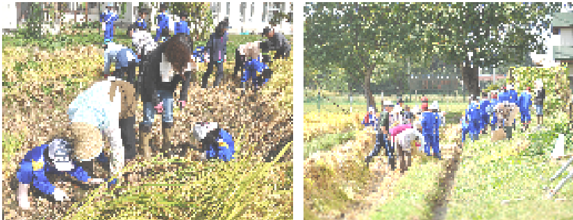
1年生もがんばりました