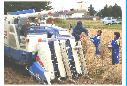
コンバインで脱穀