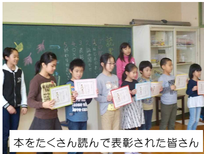
本をたくさん読んで表彰された皆さん