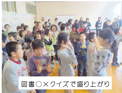
図書〇×クイズで盛り上がり