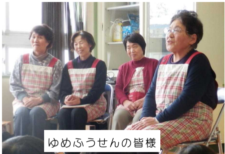
ゆめふうせんの皆様

これからも、読書を通して生活を豊かにしたり考えを深めたりすることができるように図書館活動を推進していきたいものです。