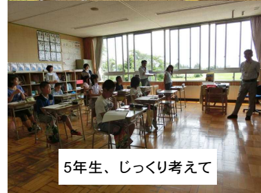
5年生、じっくり考えて