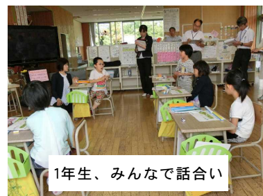
1年生、みんなで話し合い