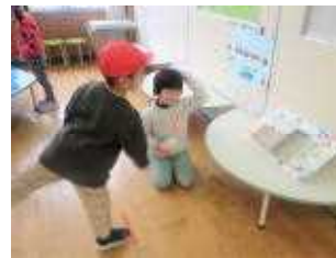
おもちゃ屋さん まとあて