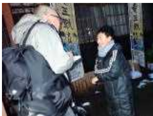
インタビューを受ける〇〇さん

市教委から、南中、角小、藤小、各校10人お出迎えの子どもを選んでおいてくださとの要請がありましたので、4年生以上の希望者の中から「あみだくじ」で当選したラッキーな9人と、直前の将棋大会で優勝した4年生の〇〇さんに行ってもらいました。