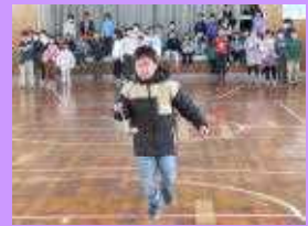
楽しい! ピンポンリレー