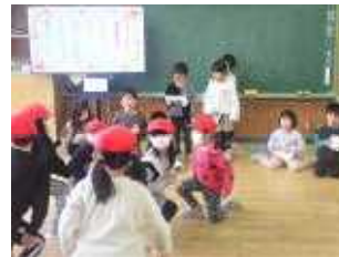
〇×クイズ むずかしいぞ～