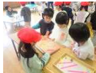
おもちゃ屋さん たまころがし

11月27日(月)、生活科の学習で、1年生が藤木保育園のキリン組さんを招待して交流しました。