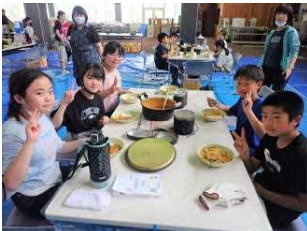
おいしいカレーライスでした 食べたら後片付け 焦げが...