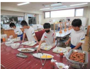
朝食はうれしいバイキング