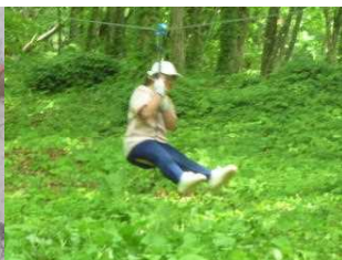
ジップラインも体験