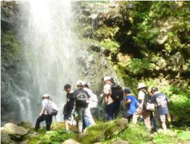
ネイチャー体験 大自然の中を進み「友情の滝」に到着

5年生は、8日・9日の2日間、田沢湖スポーツセンターで、角間川小5年生6名と合同で自然体験教室に行ってきました。