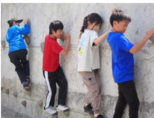
ボルダリングに挑戦

子どもたちは、写真のように様々な体験をしてきました。この他に「肝だめし」などもありとても楽しかったようです。角間川小の5年生との仲も深まり、もう来年の修学旅を楽しみにしていました。