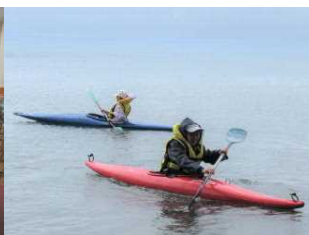
カヌー 小雨もなんのその