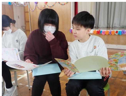
6年生へのプレゼントの「寄せ書き」