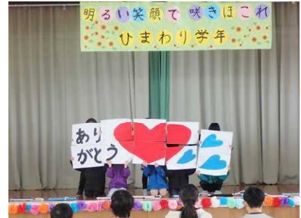
1年生「よびかけと合奏」