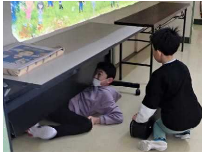
ゲーム「全校かくれんぼ」