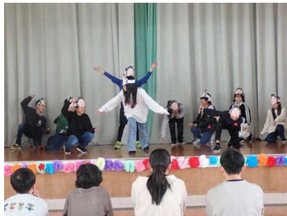
4年生「ダンス:サザエさん」