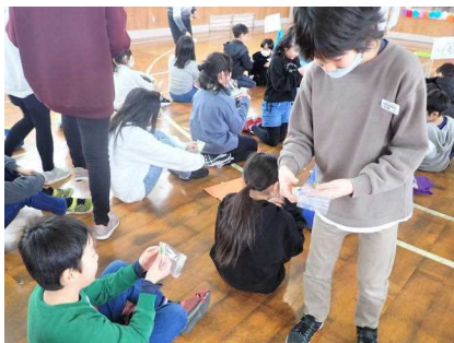
6年生からのプレゼント「キーホルダー」