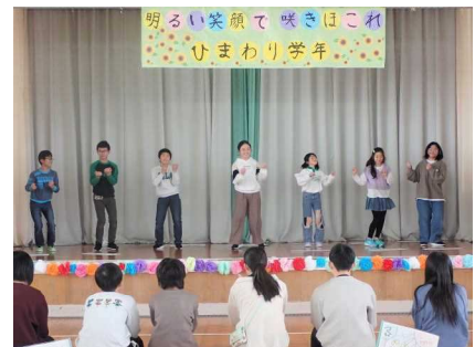
企画・進行に頑張った7人の5年生