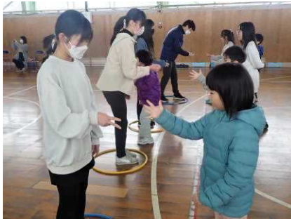
ゲーム「王様じゃんけん」

5年生のよびかけの通り、お互いにありがたいの気持ちが伝わる、あたたかく、楽しい会となりました。この良い雰囲気を大事にしながら卒業式へと向かいたいと思いました。卒業式は16日です…。