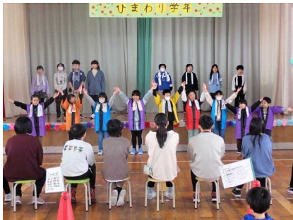
2・3年生「藤小音頭ひまわりver.」