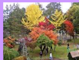
校庭の紅葉が見頃です!