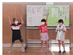
パワフルキッズ集会より

8月11日(木)～15日(月)の5日間は閉庁日です。学校は全くの無人となりますので、急用の場合には①をご覧になり、教頭までご連絡ください。