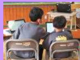
もはやタブレットは文房具