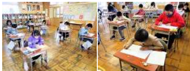
4年生 みんな真剣に!