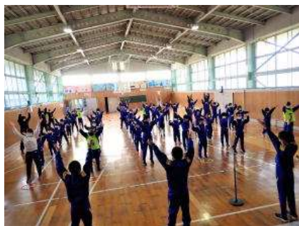
マラソン大会以来のラジオ体操

17日(水)、「藤木っ子大運動会2021」(運動委員会主催)が体育館で行われました。