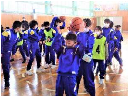
上!下!声をかけながらボールを送ります

一つ目の競技はご存知「ボール送り」です。ボールを上下交互に送って速さを競いました。各班に先生方も加わって、みんなで楽しみました。