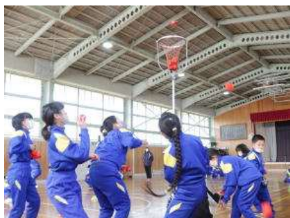
あれ?入らない! けっこう難しいかも...

次は「玉入れ」でした。低学年の種目というイメージが強いのですが、実はこれがなかなか難しい。思ったように入らず、苦戦していました。