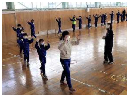
1年生もしっかり踊っていました!

最後は「藤小音頭」です。はばたきタイムに練習を重ねたので、1年生もしっかり踊っていました。体育館に大きな踊りの輪が出来ました。