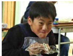
んめっ！（おいしい顔）