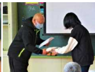
感謝状と新米の贈呈

9日(水)、農園活動や稲作体験での収穫を喜び、支えていただいた方に感謝する「収穫感謝の会」と、収穫した新米を味わう「おにとんパーティー」を行いました。