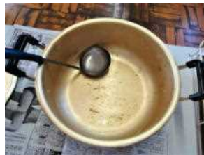
豚汁の鍋は空っぽ続出！