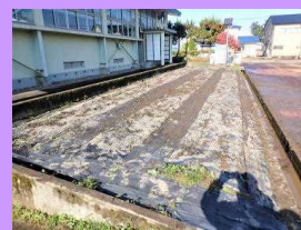
雪の花を待ちます…