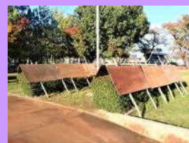
冬の備え始めました…