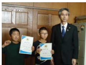
大仙ふるさと博士表彰式

やっぱり褒められるって良いものですね。俄然やる気が出ます。「褒める」って大切なんだと改めて思いました