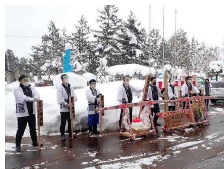
2/1 梵天披露(昭和56年会の皆様)