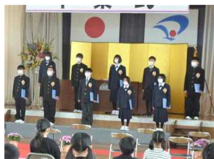
心にしみる歌と門出の詞でした