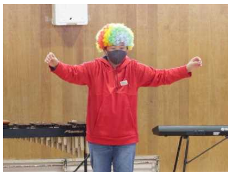
12/17 パワフルキッズ集会