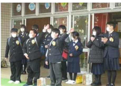
卒業生が在校生へエールを送りました