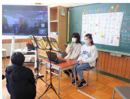
3/3 6年生を送る会(進行の5年生)