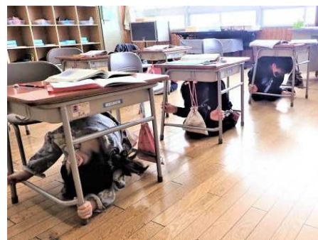
1/21 シェイクアウト訓練