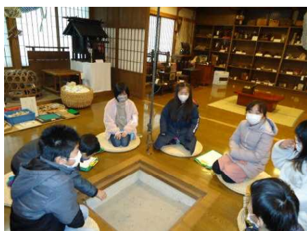
2/28 FW(南外民族資料交流館)