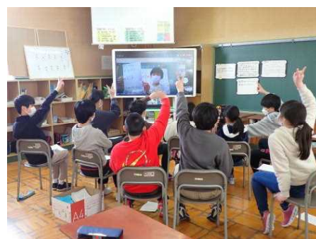
3/3 6年生を送る会(オンラインで参加)