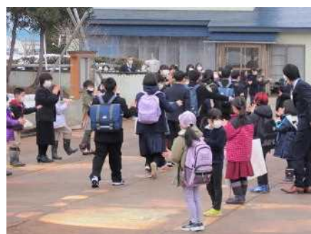
名残を惜しんで門送り さようなら…