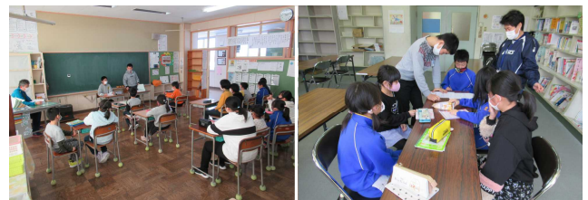
【地域子ども会の様子】

本校で行う地域子ども会はこれが最後ですが、4月6日(火)からスクールバスを利用した登下校が始まるため、春休み前に、「バス乗車の約束の確認」「バス停の場所の確認」「スクールバスの班長決め」「座席の確認」等を行う予定です。安全な登下校にするために、しっかりルールを守って利用しましょう。