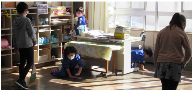
【清掃強調デーの様子】

学校では、トイレ掃除も、廊下掃除も、玄関掃除も、流しの掃除も経験していますので、是非、学校で経験し、伸びた「掃除する力」をご家庭でも一緒に取り組むことで認め、ほめてあげてほしいと思っています。