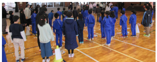
【会を運営してくれた5年生へ感謝の言葉！】