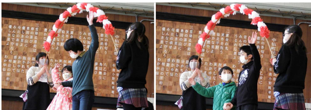
【6年生が1年生と手をつないで入場】