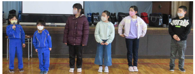
【各学年代表からの感想発表】