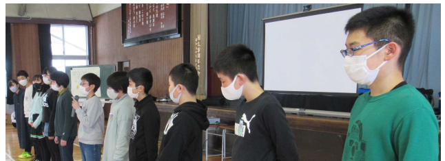
【6年生一人一人からお礼の言葉】