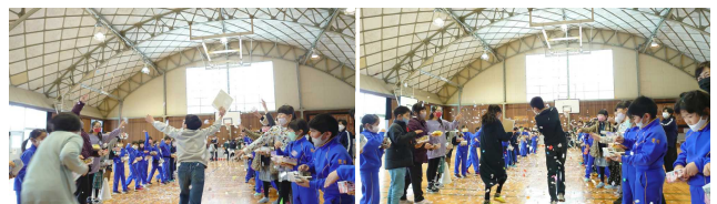
【紙吹雪の中を6年生が退場】