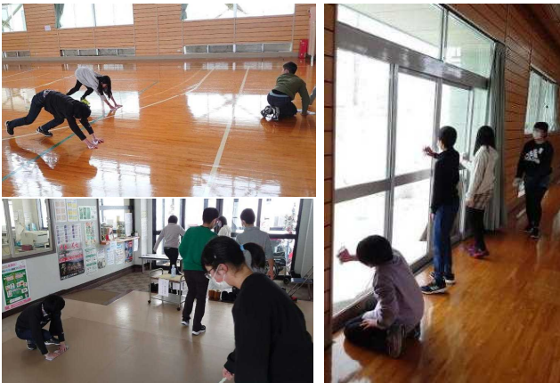
【奉仕活動の様子 がんばりました!】