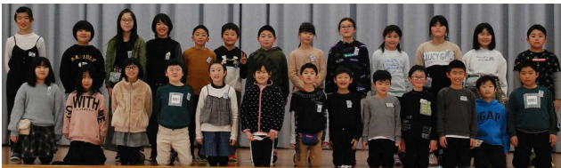
【4月から一緒です！ 楽しみですね～！】