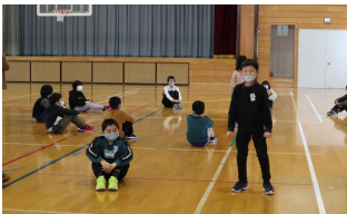
【緊張気味？の自己紹介】

4年生の子どもたちからは、「春から豊成小学校で授業を受けるのが楽しみだ」「一緒に勉強するのが、もっと楽しみになった」「豊成小になるのが楽しみだ」「豊成小でもみんなと仲良くしたい」という感想が聞かれました。よかったですね～！