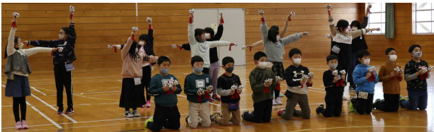
【『小沼山の詞』の踊り』を見てもらいました】