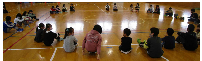
【入学児童と豊川小1・5年生との交流会】

新しい仲間を迎え、総勢105名で新生豊成小学校がスタートする予定です！楽しみですね！