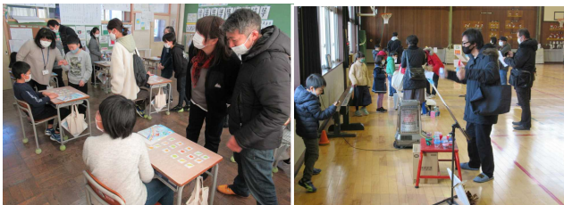
(左: 4年) 英語で会話 (右: 1・2年) おもちゃで 【授業参観の様子】

6年生の学級懇談会には、中仙中学校の戸嶋校長先生と山嘉さんが来て、中仙中学校の新しい制服等について説明をしてくださいました。日曜日なのに、本当に、ありがとうございました。