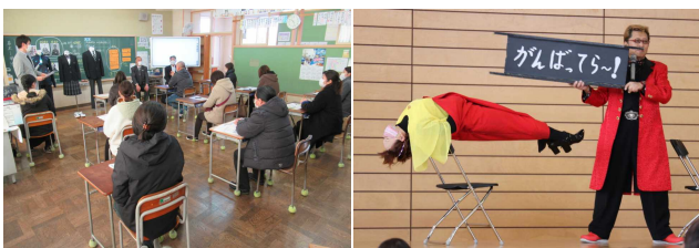
【6年 学級懇談】 【閉校記念講演会】