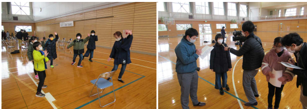
【活動の様子と取材される様子…緊張します！】