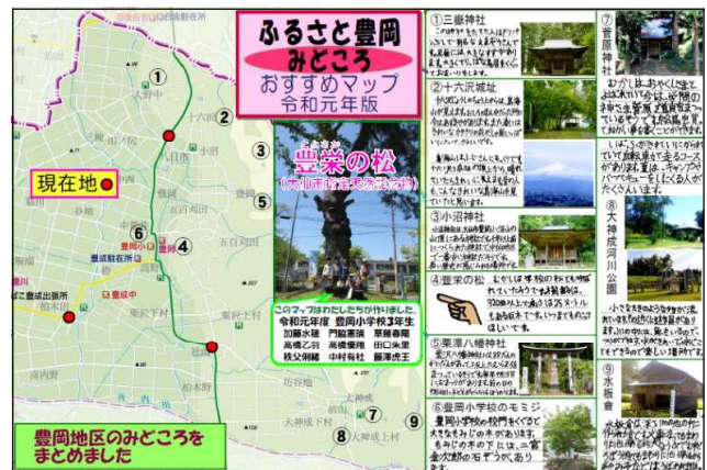
【豊岡地区の観光案内板の役目を果たした看板】

なお、この取組は今年度で一旦、終了します。豊成小学校での新たな取組に期待します。