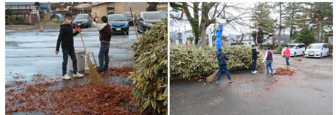
【(24日の様子)よく働いてくれます(25日の様子)】