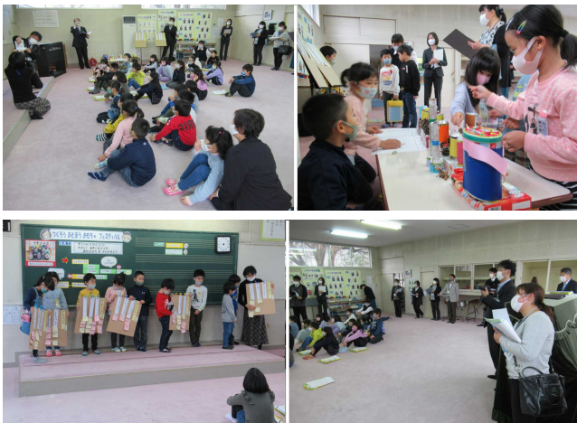
【1・2年生 生活科の授業の様子】

授業を参観した皆さんからは、2年生が1年生の作ったおもちゃで遊んだ後に、理由を付けて長い文章を付せんに書く姿や、2年生からもらった付せんを内容ごとに仕分けして貼り直す1年生の姿等に、「驚いた。ふだんの授業の積み重ねの成果なのかもしれませんが、ここまでできるとは…」等のおほめの感想をたくさんいただきました。そして、指導主事さんからは、「この後も、四つの目(温かい目、広い目、長い目、基本の目)で子どもたちを見守りながら支援の在り方を工夫してほしい」「保育園とのつながりを大切にしたい授業づくりを続けてほしい」等の助言をいただきました。皆さん、本当に、ありがとうございました。