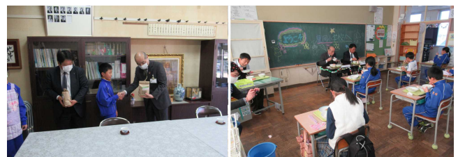
【お米のプレゼント】【5年生の教室で一緒に！】

給食を食べる前には、5年生から学校田でとれたお米「豊岡夢こまち」のプレゼントがあり、皆