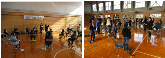
【どんぱん節の踊りを見て、みんなで歌いました】

12月3日（木）に行われる2回目では、手踊りを教えてもらったり、和楽器を体験したりした後、その成果を発表する会を行う予定です。また、テレビや新聞の取材もあるようです。皆さん、がんばってくださいね！