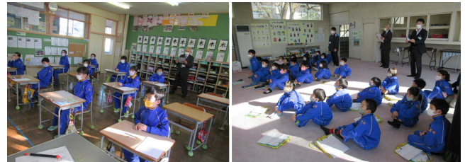
【3年生(左)、1・2年生(右)の授業参観の様子】

その後、校長室で、学校の様子や授業についての感想を聞いたり、情報交換をしたりしました。その中で、「子どもがしっかりと話を聞いている。先生との関わりもよい。」「学級経営に統一感がある。」「学級にいて安心できる雰囲気があり、子どもへの声かけに、意欲を高めようとするなど、学校として取り組んでいることの意図が感じられる。」などのおほめの言葉をたくさんいただきました。先生たちにもそのことを伝え、「これからも、子どもたちをしっかりと育てていこう」と、確認したところです。小笠原アドバイザー、いろいろ教えてくださり、ありがとうございました。