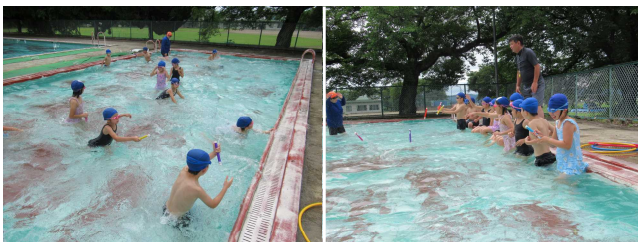
【2年生の水泳授業の様子】