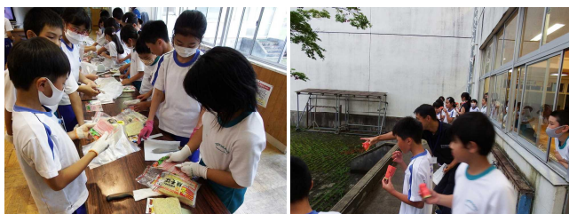
【1日目の様子 日程と合わせてご覧ください】