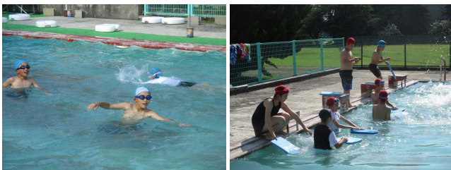
【5・6年生の水泳授業の様子】