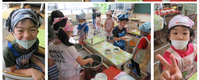
【自分たちで準備☆笑顔いっぱいの1年生です】