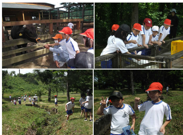
【モリボの里での動の様子】

余談になりますが、1年生が教室に戻ったら、教室の黒板に「おかえりなさい。たのしかったですか？たのしかったこと、おしえてね。7はんより」というメッセージが残されていたそうです。1年生の教室を掃除してくれた縦割7班の皆さんの気遣いと優しさでした。すばらしいなあ！