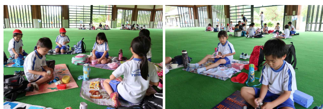
【おいしいお弁当 ありがとう！】