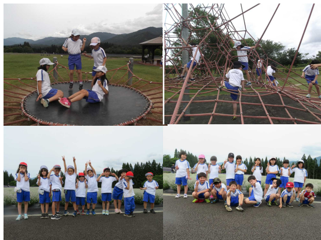
【ラベンダー園で 楽しい一時】