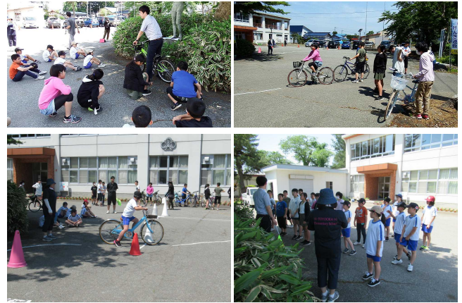
【6年生(上)と4年生(下)の活動の様子】

確認いただければと思います。また、何度もお願いしていますが、ヘルメットの購入・着用についても、ご検討いただけるとありがたく思います。