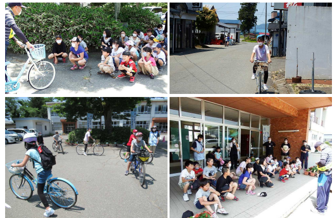
【3・5年生の活動の様子】