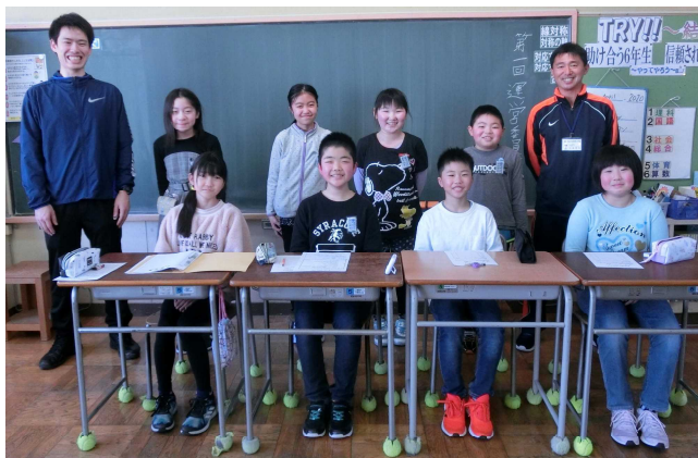
【運営委員会のみなさん】

児童会活動は、学校をよりよくするために、子どもたちの「やってみたい」「こうしたい」という思いを生かして行う活動です。先生に言われなくても、自分が気付いたこと・考えたことを、仲間に提案し、先生とも相談しながら、一緒に行動に移してほしいと願っています。うまくいか、いかないかは別です。まずは、行動すること！その期待を込めて、集合写真を紹介します。