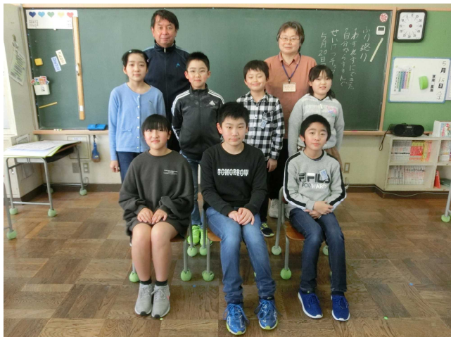
【健康委員会のみなさん】