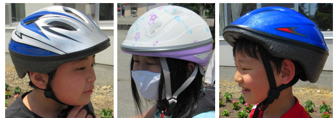
【軽〜いヘルメットでした。かっこいい！】