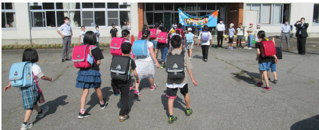
【この日は、豊成中学校の校長先生も様子を見に来てくれました】

これらの活動を通じて、「あいさつ」がさらに改善され、地域の皆さんに元気を与え、学校にも活力を与えてくれるようになることを期待しながら、これからも、みんなでがんばっていきましょう！