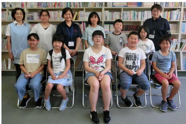
【図書委員会のみなさん】