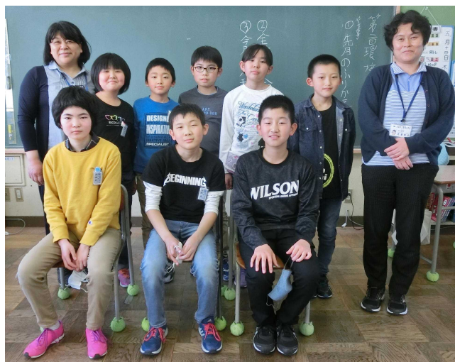
【環境美化委員会のみなさん】