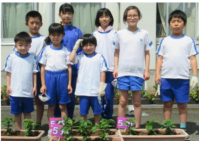
【プランターを前に 上から1班～5班】