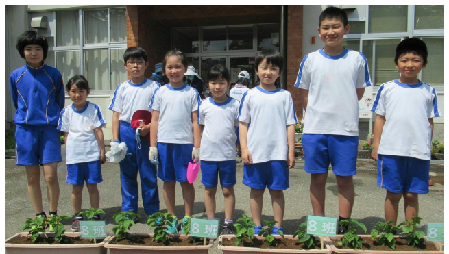
【プランターを前に 上から6班～8班】