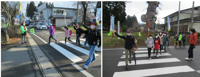
【PTA校外指導部の皆さんによる安全指導】

入学式が終わり、初めての集団登校、初日1時間目の授業、初めての岡小タイム…。1年生の「初めて」の様子を紹介します。