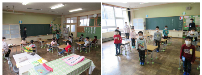
【1時間目：あいさつ・へんじ…の練習】