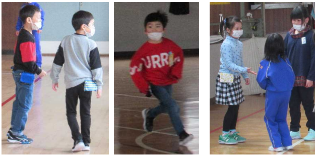
上 ～体育館で～ 【初めての岡小タイム】