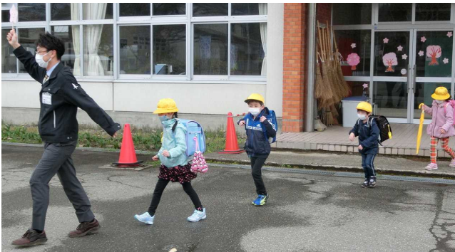
【初めての下校指導 ～教頭先生と一緒に～】

下校途中、「疲れた～」と言っている子どもに、「何が疲れるの？」と聞いてみたら、「ランドセルが重くて」とのことでした。ランドセルを背負って、長い道のりを歩くことは大変だと思いますが、それを繰り返すことで、病気に負けない強い体をつくってほしいと願っています。がんばって！