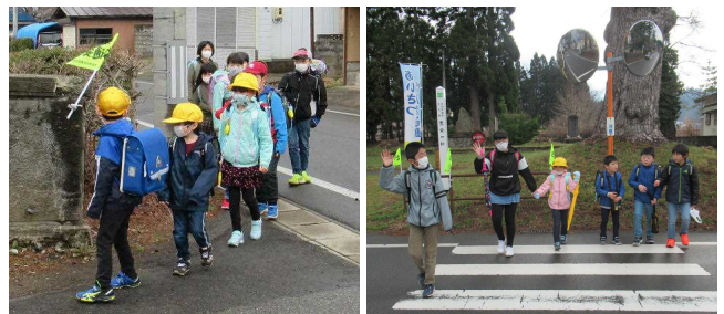
【初めての集団登校】