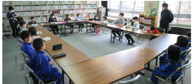
【地域子ども会の様子】