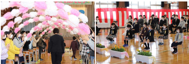
【お花のアーチをくぐって入場～緊張しますよね！】