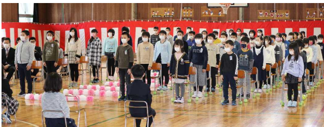
【全校児童による「歓迎の言葉」】