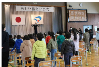
【郷土をたたえる歌】