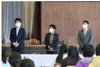
【3名の新しい先生方】

3名の先生方から、「新しい風」を豊岡小学校に吹き込んでもらい、子どもたちに、楽しく、充実した1年だったと思ってもらえるようにがんばります。どうか、よろしくお願いいたします！