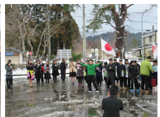
【歓送 エールの交換】