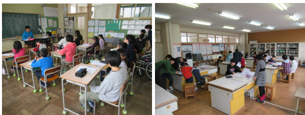
【地域子ども会の様子】

7日（木）、第4回地域子ども会が開催されました。今回は、4月からの登校班長や副班長を決めたり、登校班に加わる新入生を確認したり、4月からの集合場所や集合時間を決めたりしました。また、新しい班長さんが、新入生に、決まったこととお知らせするお手紙を書いて、新入生の自宅に届けることになっています。新しい班長さん、副班長さん、班の登校の安全を守るため、どうか、よろしくをお願いします。