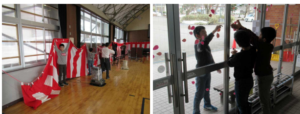
【卒業式の準備風景】

6年生への感謝の気持ちを伝えるため、姿勢正しく、大きな声で、りりしく式に参加した1～5年生の皆さんは、本当に立派でした。よくがんばりましたね！すばらしいです！