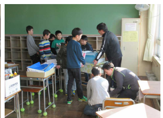
【卒業式の後片付け風景】

準備や卒業生の歓送・エール交換で、5年生が大変よくがんばってくれました。下級生をリードして活躍してくれ、最上級生になる準備が整いつつあるようです。来年度が楽しみです！