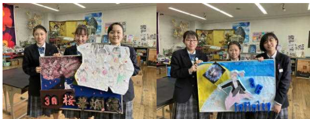
「桜華爛漫」 「infinity(無限)」 3年A組 3年B組