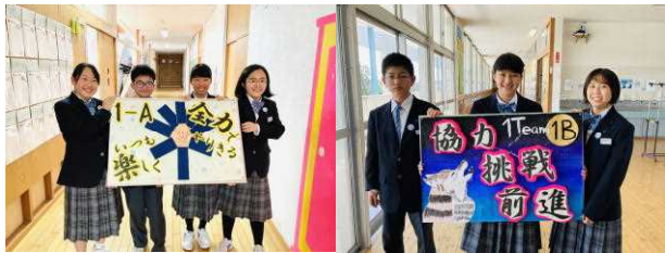
「いつも楽しく全力でやりきる」 「協力 挑戦 前進」 1年A組 1年B組