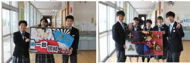
「一致団結」 「十人十色 One for All」 2年A組 2年B組