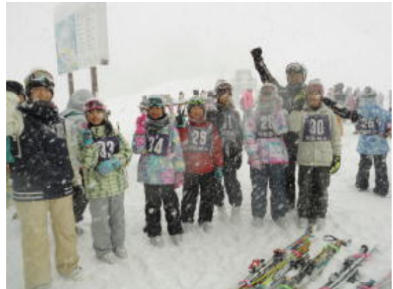
「出発前に記念撮影！」