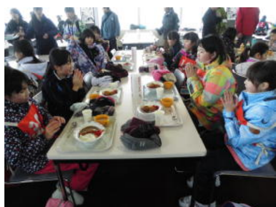
「外は寒かったから、カレーライスがあったかくておいしいね。」