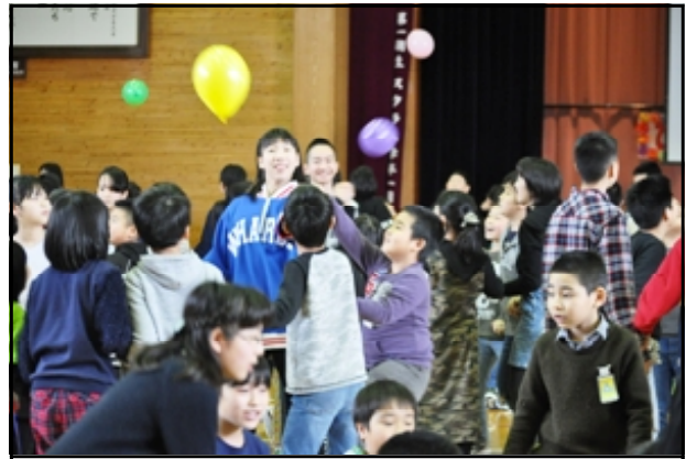
全校みんなで「風船バレー」