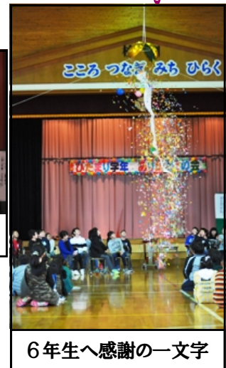
6年生へ感謝の一文字