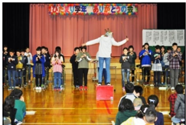
「6年生から音楽のプレゼント」(ふるさと♪)