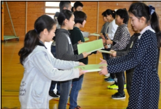
委員会の引き継ぎ（5年生の委員へ）