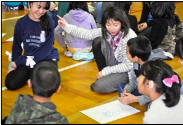
ゲーム「似顔絵作成中」