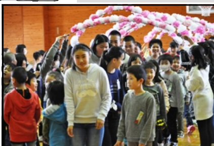
6年生入場 (1年生と一緒に)