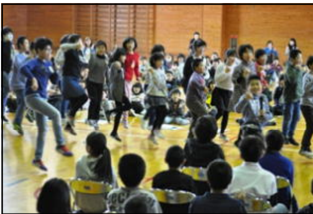
「ひだまり学年 USA 5年生」(ダンスと歌)