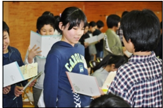
6年生へのプレゼント（縦割りグループのメッセージ）