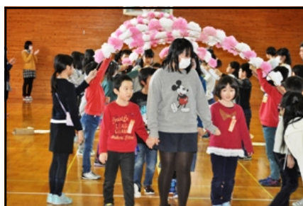
6年生入場 (1年生と一緒に)