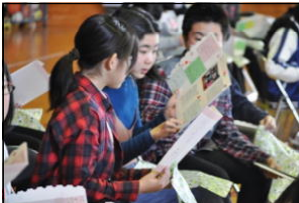
6年生へのプレゼント (縦割りグループのメッセージ)