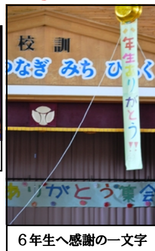
6年生へ感謝の一文字