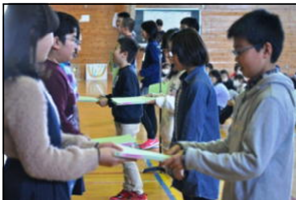
委員会の引き継ぎ (5年生の委員へ)