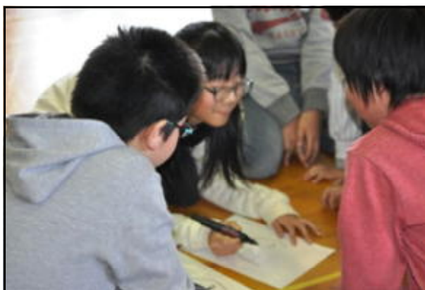
ゲーム「似顔絵作成中」