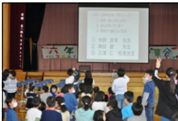
全校みんなで「クイズタイム」