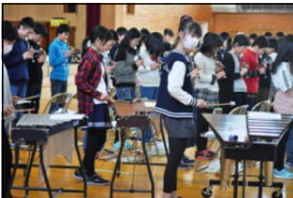
「6年生から音楽のプレゼント」(風を切って 他)