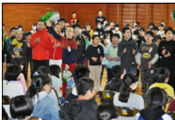
「6年生へエール」5年生が中心となって