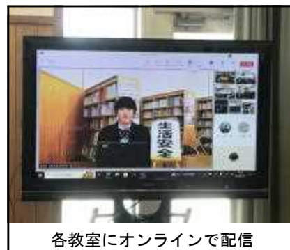
各教室にオンラインで配信