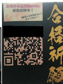
蒼翔学年応援ムービー QRコードでご覧ください。