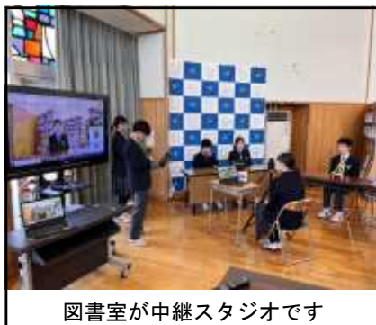
図書室が中継スタジオです