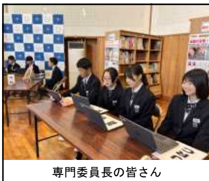
専門委員長の皆さん