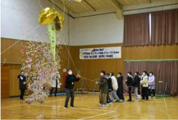
～恒例の「くす玉割り」も見事に成功！～

とにかく5年生ががんばった！ ものすごい感謝の会でした！ ていねいな計画と準備。明るい進行と、盛り上げる意気込みが最高でした。来年の中仙小学校も、ますます楽しい学校になることを、全校みんなが確信できました。1～4年生も、各学年それぞれの手作りプレゼントがとっても素敵でした。6年生も笑顔満開で、「ありがとう！」の言葉が体育館に響き渡りました。心の響き合う学校、中仙小学校！みんながみんなにありがとう