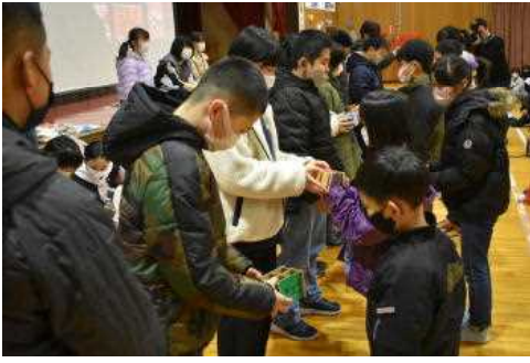
～在校生へ「ペン立て」をプレゼント～

とにかく5年生ががんばった！ ものすごい感謝の会でした！ ていねいな計画と準備。明るい進行と、盛り上げる意気込みが最高でした。来年の中仙小学校も、ますます楽しい学校になることを、全校みんなが確信できました。1～4年生も、各学年それぞれの手作りプレゼントがとっても素敵でした。6年生も笑顔満開で、「ありがとう！」の言葉が体育館に響き渡りました。心の響き合う学校、中仙小学校！みんながみんなにありがとう