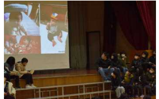
～赤ちゃんのころの写真クイズ～