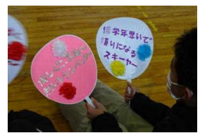
すてきなプレゼント！