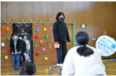
～1人ずつ、よいところを紹介されながらの入場～

3月は『心を育てる』こと。そして、「“楽笑(らくSHOW)”な学校」の『SHOW』としての『ラスト・集大成の卒業式』に向けて、全校みんなで“ありがとうの心”を大切に、丁寧に育てていきたいと思えます。 その第1弾として、3月1日(金)に、5年生のリードする力と全校みんなの優しさをつなげて、素敵で“楽笑な時間”、「6年生を送る会」をやり遂げました。 在校生は手づくりの「しおり・似顔絵メダル・コースター・メッセージ台紙・うちわ」を6年生にプレゼントしました。6年生からは各学年に、「ペン立て」が、そして、好きなキャラクターの「手作りプラ板」が1人1人にプレゼントされました。