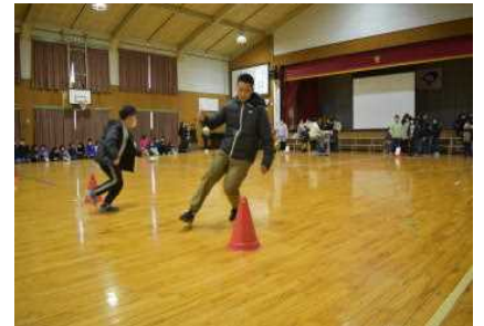
～どんぱんグループ対抗「おたまリレー」～