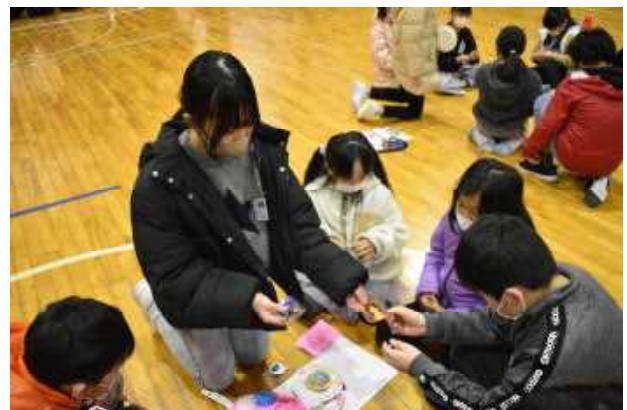
～在校生から卒業生へ、卒業生から在校生への手作りプレゼントの交換～