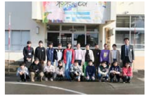
学級写真第1号は6年生