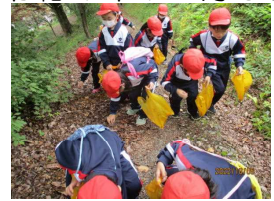
1年生 八乙女山で秋さがし