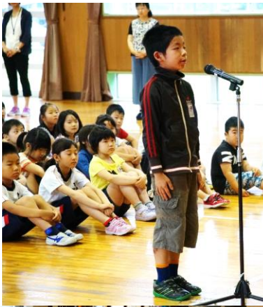
児童代表歓迎の言葉